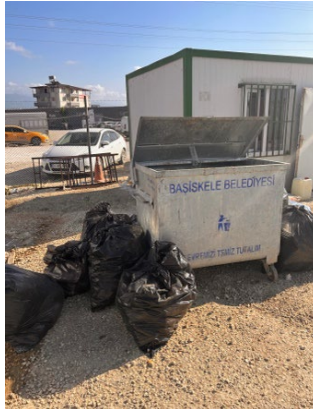
Kocaeli Çadırkenti Konteyner Bölgesi