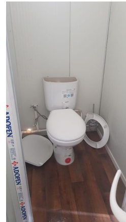
Kocaeli Belediyesi Çadırkenti

Yukarıda yer alan çocuk ifadeleri ve yapılan gözlemler çerçevesinde çocukların temiz ve yeterli banyo ile tuvalete tam olarak erişemediği tespit edilmiştir. Çocukların fizyolojik ihtiyaçlarını karşılamaları ve hijyen koşullarını oldukça önemlidir. Bu kapsamda, çocuklara uygun temiz,