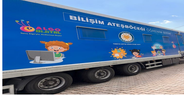
TEGV Bilişim Gezici Aracı