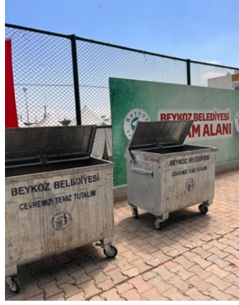
Beykoz Çadırkenti Konteyner Bölgesi