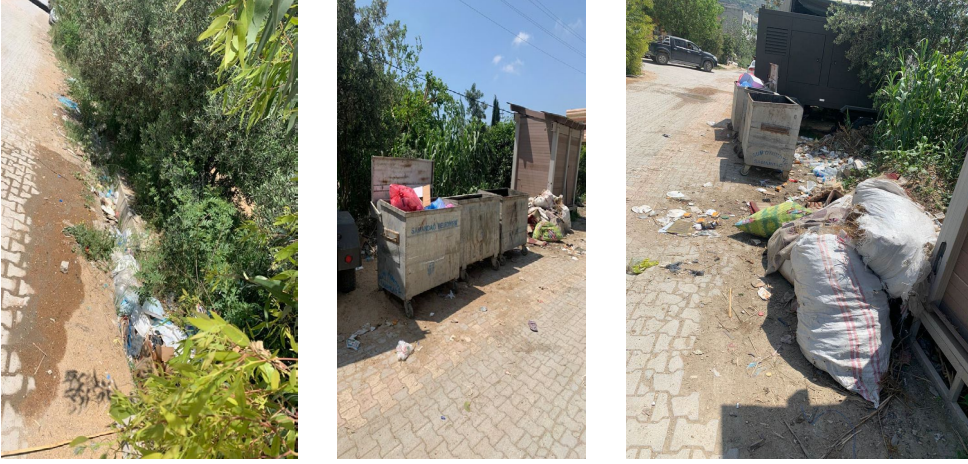
Sutaşı Çadırkent Çevresi