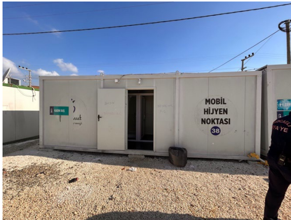
Kocaeli Belediyesi Çadırkenti