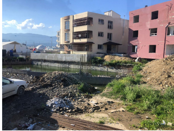
Kocaeli Çadırkenti çevresi