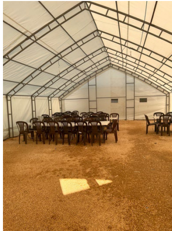
Kocaeli Belediyesi Çadırkenti

“Her gün kuru fasulye pilav veriyorlar.”