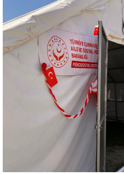
Beykoz Belediyesi Çadırkenti

Çocukların bedensel ve zihinsel gelişim hakkı, çocukların sağlıklı bir şekilde büyümelerini, fiziksel ve zihinsel potansiyellerini tam olarak geliştirmelerini temel haklarından biridir. Bu hak, düzenli sağlık kontrolleri, erken tanı ve tedavi hizmetleri, rehabilitasyon hizmetleri ve psikososyal destek gibi sağlık hizmetlerini içermektedir. Yukarıda yer alan çocuk ifadeleri, yetkili görüşmeleri ve yapılan gözlemler çerçevesinde deprem ardından çocuk gelişiminin olumsuz etkilendiği, psikososyal hizmetlerin yetersiz kaldığı tespit edilmiştir. Bu kapsamda, çocuklara uygun ve erişilebilir sağlık hizmetlerinin sunulmasını, çocuklar talebi beklenmeksizin ilgili psikologlar tarafından çocuklar ile görüşme sağlanması, bu görüşmelerin belli bir sistem çerçevesinde yapılması, çocukların hastalıklarının tespiti için düzenli kontrollerin sağlanması, tedavi hizmetlerinin uygulanması gerektirmektedir.