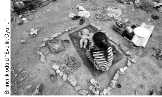
Birincilik ödülü "Evcilik Oyunu"

Türkiye Barolar Birliği'nin 2015 yılı Avukatlar Günü dolayısıyla düzenlenen Hukukçular Arası Fotoğraf Yarışması sonuçlandı.