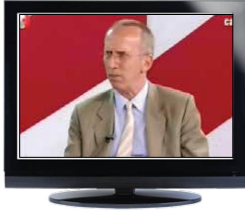
Av. Hüseyin Özbek Genel Sekreter