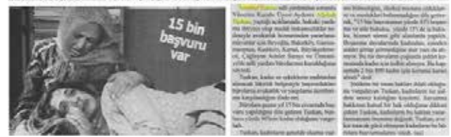
İstanbul Barosu Adli Yardım Bürosunun çalışmaları HABERTÜRK Televizyonu tarafından haberleştirildi. Haber, televizyonun 24 Şubat 2015 Salı günü saat 17.00'da haber bülteninde yayınlandı. Programda İstanbul Barosu Kadın ve Çocuk Haklarından sorumlu Yönetim Kurulu Sayman Üyesi Av. Aydeniz Alisbah Tuskan Adli Yardım çalışmaları hakkında bilgi verdi.

İstanbul Barosu'nun adli yardım bürolarına geçen yıl başvuran yaklaşık 15 bin kişiden 2 bin 800 kadın hakkında, eşinden şiddet görmesi nedeniyle koruma kararı alındı.