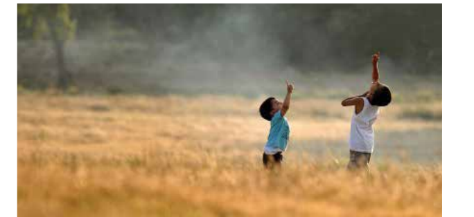
Mansiyon "Gökyüzüne ilk kim dokunacak"