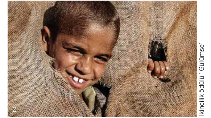
İkincilik ödülü "Gülümse"