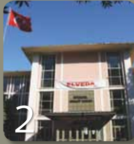
İstanbul Barosu Yeni Adli Yıl Açılışında Tüm Üyelerini “Son Duruşmaya” Davet Etti