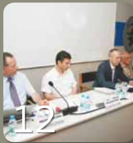
Bağımsızlık Mücadelesinden Bağımsızlık Belgesine: “88. Yılında Lozan” Paneli