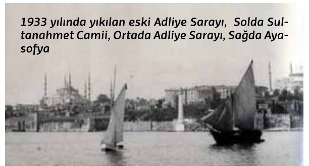
1933 yılında yıkılan eski Adliye Sarayı, Solda Sultanahmet Camii, Ortada Adliye Sarayı, Sağda Ayasofya

Çağlayan'da yapımı tamamlanan İstanbul Adalet Sarayı'nın hizmete girmesiyle, 56 yıllık görev süresini tamamlayan Sultanahmet Adliyesi emekli oldu. ♦