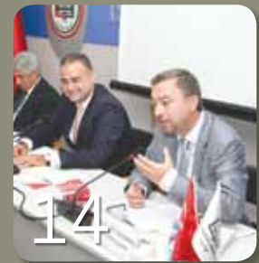
İfade Özgürlüğü Kapsamında Basın Özgürlüğü