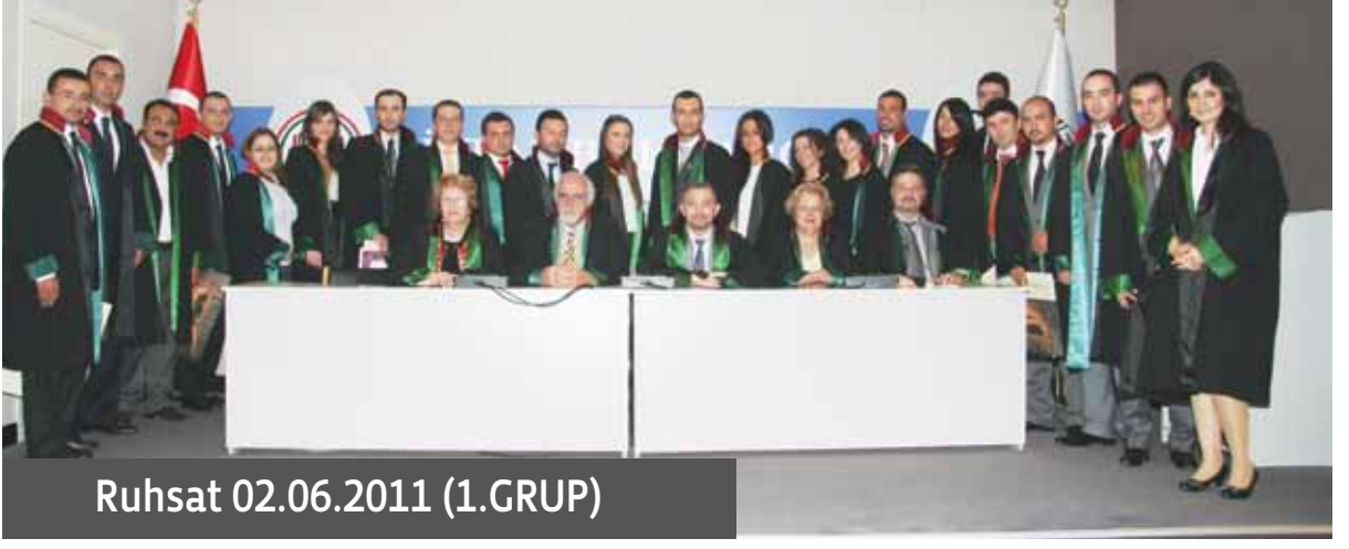
Ruhsat 02.06.2011 (1.GRUP)