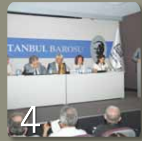
İstanbul Barosu, Baro Meclisi Toplandı