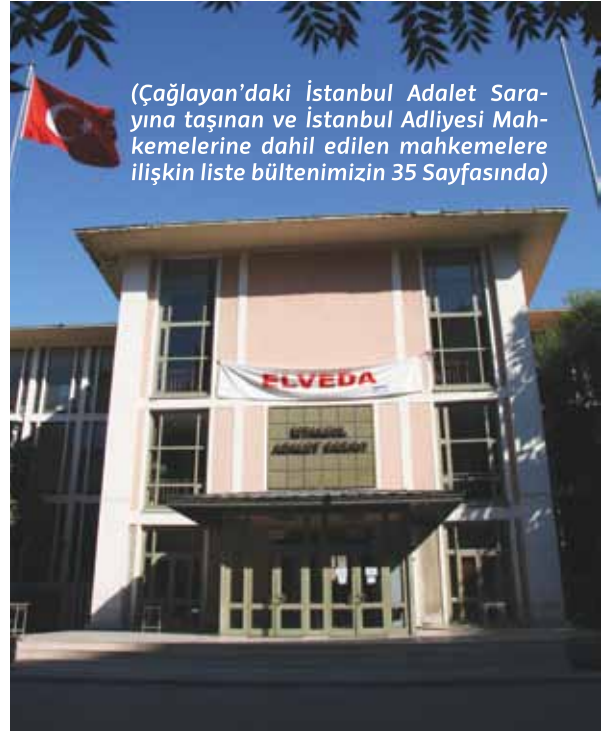
(Çağlayan'daki İstanbul Adalet Sarayına taşınan ve İstanbul Adliyesi Mahkemelerine dahil edilen mahkemelere ilişkin liste bültenimizin 35 Sayfasında)

1949'da Adliye Sarayı için proje yarışması yeniden gündeme geldi. Yarışmayı kazanan proje, dönemin önde gelen iki Türk mimarından ikisinin, Prof. Dr. Sedat Hakkı Eldem ve Prof. Dr. Emin Halid Onat'ın imzasını taşıyordu. Ancak bu projenin yalnızca birinci bölümü, yani mahkemeler bloğu uygulandı. 1951'de inşaatına başlanan bu bina, 1955'de hizmete girdi. 1958'de yapılan kazılarda Bizans döneminden kalma önemli arkeolojik buluntular ortaya çıktı. Adliye Sarayı'nın uygulanan ilk bölümünün (A ve B blokları) inşa edilmesinden ve arada proje mimarlarından Emin Onat'ın 1961'de ölmesinden sonra, Sedat Hakkı Eldem, arkeolojik buluntuları da dikkate alarak, bunların üstünü kısmen örten ve Adliye Sarayı'nın uygulanmayan bölümünü yine de inşa edebilmeyi öngören yeni bir proje geliştirdi. Ancak bu proje de, Anıtlar Kurulu'nu olumlu kararına rağmen, uygulanma olanağı bulamadı. 4,000 m 2 alan üzerine yayılmış, ikisi yerin altında,