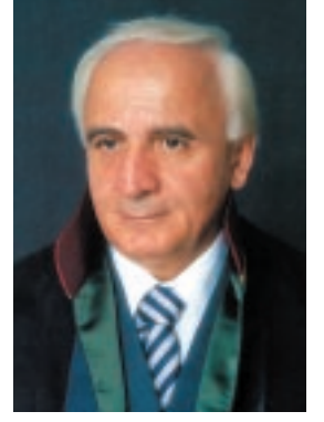
Av. Kâzım Kolcuoğlu