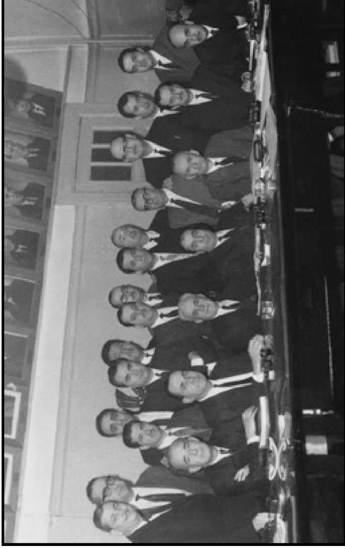
Bir Baro seçiminden sonra yeni ve eski yöneticiler biraradayken.