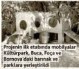
'Projenin ilk etabında mobilyalar Kültürpark, Bece, Feza ve Bornova'daki barkın ve parklara yerleştirildi'

AKP'nin bir süredir üzerinde çalıştığı sokak hayvanları ile ilgili düzenleme Cumhurbaşkanlığı Recep Tayyip Erdoğan'a sunuldu. Düzenlemeye ilişkin yapılacak son röportajın ardından teklifin önümüzdeki günlerde TBMM Başkanlığı'na ulaşması bekleniyor. Teklifte yer alan sokak hayvanlarının üyütülmesini öngören maddeler ise tartışılan konulardan birisi. Kamuoyunda yer alan tepkilerin ardından bannaklara toplanılan ve bir ay içinde sahiptendirilmeyen sağlıklı hayvanların üyütülmesi konusunda geri adım atıldığı ifade edildi. Belediyeler üzerindeki denetimlerin de artırılmasını öngörüyor. Yeni çalışmaları hayvan hakları savunucularıyla konuştuk. Hayvanlara Adalet Derneği Başkanı-Avukat Barış Karlı, "AKP, köpekleri yaka, tehlikeli,