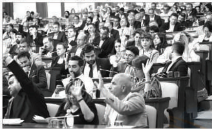
Barosu ile protokol yapacağız. Adli yardım hak arama özgürlüğünün önemi de engellerin kaldırılmasında ve yoksul bireylerin, şiddete maruz kalmış kadın ve çocukların adaletle erişimleri açısından önemli bir mekanizmadır." ifadelerini kullandı.