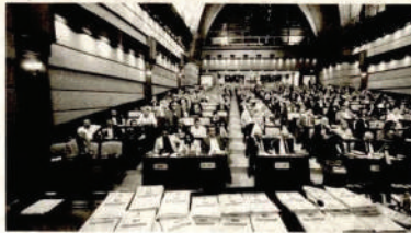
letin ve hukukun üstünlüğünün sağlanmasına katkıda bulunmak olarak tanımlanıyor.

Protokolün amacı, adli yardım sisteminin işleyişini iyileştirerek, toplumsal ada-