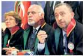
Baro Başkanı Ümit Kocasa-kal, Avukatlar Günü ve İstanbul Barosu'nun katıldığı toplantıda konuşuyor.

Avukatlar Günü nedeniyle açıklama yapan İstanbul Barosu Başkanı Kocasa-kal avukatlara yönelik saldırıların eleştirildi: Artık 5 Nisan bizim için, 1 Mayıs emekçiler için neyi ifade ediyorsa odur