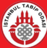
İstanbul Tabip Odası