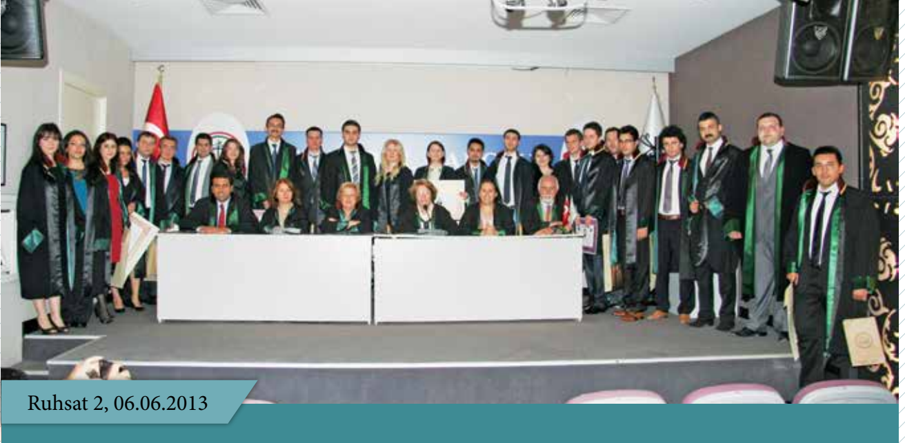
Ruhsat 2, 06.06.2013