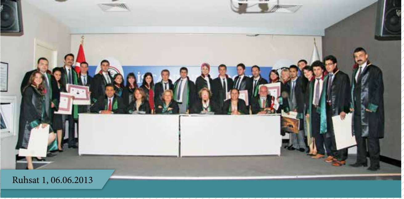
Ruhsat 1, 06.06.2013