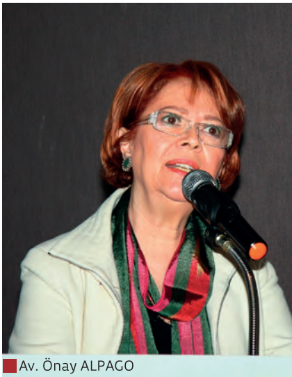
Av. Önay ALPAGO

Eski Devlet Bakanı Av. Önay Alpago, kadınların giderek daha zor şartlarda yaşadığı bir ülkede, kadınların yaşam haklarının savunur hale geldiğini, her gün yeni bir kadın cinayeti yaşandığını ve artık şiddetin coğrafyasının bulunmadığını söyle-