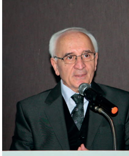
Av. Kazım KOLCUOĞLU

di. Alpago, Cumhuriyetin bir kadın devrimini gerçekleştirdiğini, oysa bugün kadınların bir karşı devrimle karşı karşıya kaldıklarını bildirdi.