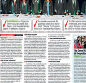
Yeni Akit muhabirinin provokasyonu! Baro Başkanı Ümit Kocasakal, 'Savunma dimdik ayakta' sloganıyla basın toplantısı düzenledi.

Yeni Akit muhabirinin provokasyonu! Baro Başkanı Ümit Kocasakal, 'Savunma dimdik ayakta' sloganıyla basın toplantısı düzenledi. Kocasakal, 'Savunma dimdik ayakta' sloganıyla basın toplantısı düzenledi. Kocasakal, 'Savunma dimdik ayakta' sloganıyla basın toplantısı düzenledi.