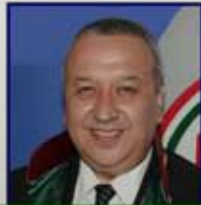
16553 Av. Ufuk ÖZKAP