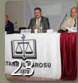
Türk Ticaret Kanunu Eğitim Semineri: XIV