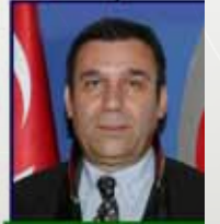
15614 Av. Turgay DEMİRCİ