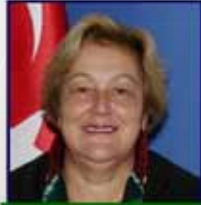
10048 Av. Aydeniz A. TUSKAN