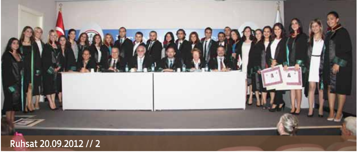
Ruhsat 20.09.2012 // 2