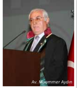
Av. Muammer Aydın

Muammer Aydın, kendi döneminde Yönetim Kurulundaki muhalefet yüzünden bazı çalışmalarını yapamadıklarını hatırlattı ve kendi döneminde yapılan çalışmalar hakkında bilgi verdi.