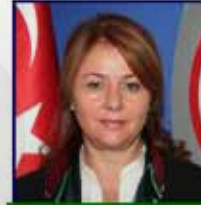
14253 Av. Süreyya TURAN