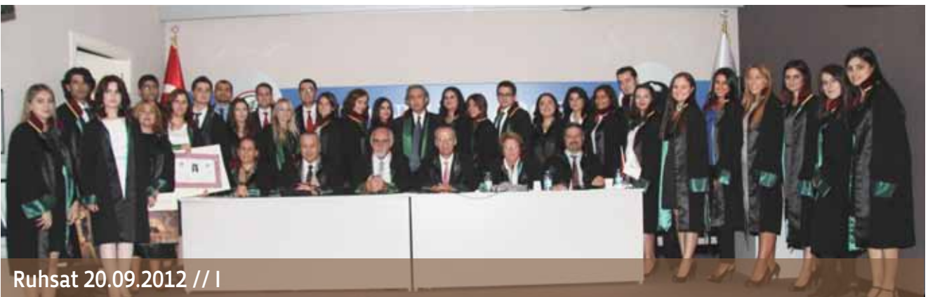
Ruhsat 20.09.2012 // I