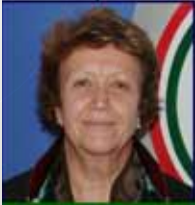
8819 Av. Füsun DİKMENLİ