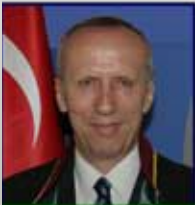
16214 Av. Hüseyin ÖZBEK