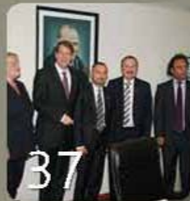
Alman Heyeti Baromuzu Ziyaret Etti