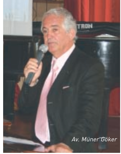
Av. Münir Göker

Av. Münir Göker 'in şiirlerle süsleyerek sunduğu gecede konu-