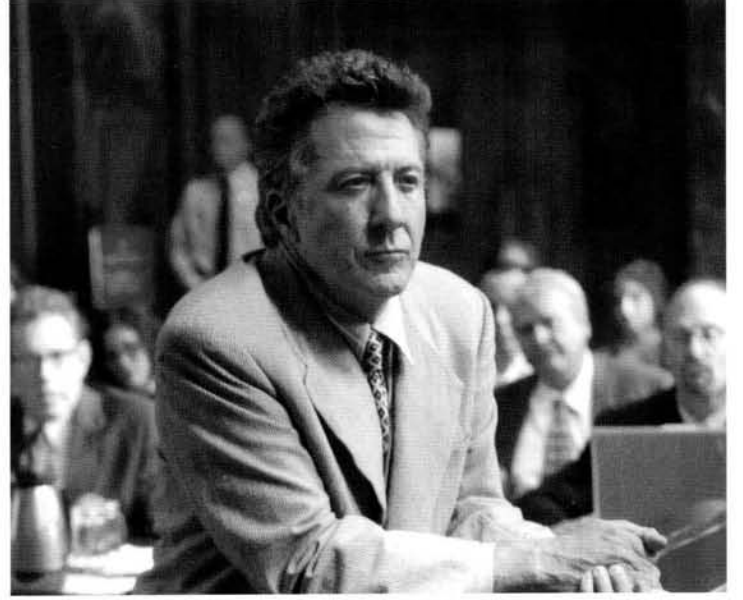
Dustin HOFFMAN "Jüri" filminde avukat rolünde.

Günde 4 ayrı seansın yapılacağı söz konusu tarihlerde saat 13.30 seansları İstanbul Bilgi Üniversitesi'nin Dolapdere Kampüsünde, 16.30, 19.30 ve 21.30 seansları ise Atatürk Kültür Merkezi Sinema salonunda gerçekleştirilecek.