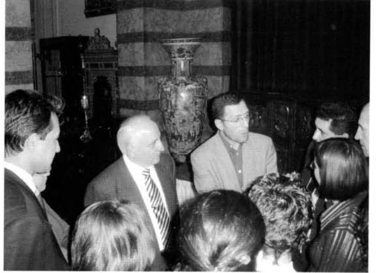
İstanbul Barosu Başkanı Av. Kâzım KOLCUOĞLU, Pera Palas'ta düzenlenen kokteylde gazetecilerle birlikte.

Bu nedenle Baro bünyesinde Basın Danışmanlığı oluşturduklarını hatırlatan Kolcuoğlu, bundan böyle Baro – medya ilişkilerinin sürekli hale getirileceğini ve bu tür buluşmaların her iki tarafın da yararına olduğunu sözlerine ekledi.