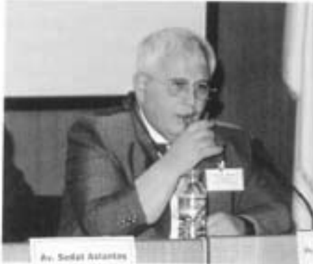
Av. Sedat ALTINTAŞ

İHAS’ın 3. Maddesinde düzenlenen işkence yasağına ilişkin görüşlerini aktardı.