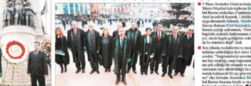
5 Nisan Avukatlar Günü İstanbul'da 'Yargı bağımsızlığının yok sayıldığı' gerekçesiyle kutlanmadı. Diyarbakır Barosu 'Anadilde savunma' mesajı verirken Adana'da da AKP politikaları eleştiri topladı.

Avukatlar, Avukatlar Günü'nü, "Savunma hakkının gasbedildiği, avukatların yok sayıldığı, meslektaşlarının saldırıya uğradığı ve yargı bağımsızlığının yok edildiği" gerekçesiyle kutlamadı.