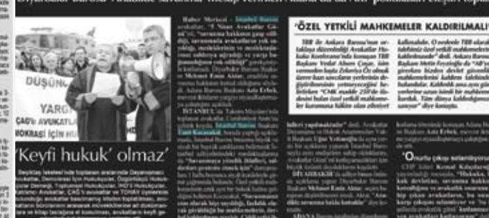
5 Nisan Avukatlar Günü İstanbul'da 'Yargı bağımsızlığının yok sayıldığı' gerekçesiyle kutlanmadı. Diyarbakır Barosu 'Anadilde savunma' mesajı verirken Adana'da da AKP politikaları eleştiri topladı.