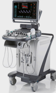
DİJİTAL ULTRASON VE RENKLİ DOPPLER