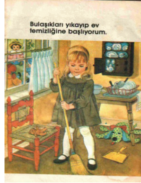
“Bulaşıkları yıkayıp ev temizliğine başlıyorum”

Yukarıdaki iki resim rol modellerin keskin ayrımını yansıtır. Baba, arabalarla ilgilenirken; anne temizlik, yemek ve bulaşıkla ilgilenmelidir. Ayrıca her iki cinse uygun görülen oyuncaklara baktığımızda biçilen rol model özdeşleşmesi araçlardan başlayarak gerçekleştirilmektedir. Resimlerdeki öznelerin yerini değiştirdiğimizde eğer farklı bir eğitim ve gelişim sürecinden geçemişsek bizi çok rahatsız edici bir durumla karşılaşacağımızı söyleyebiliriz.