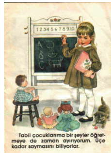
“Tabii çocuklarıma bir şeyler öğretmeye de zaman ayırıyorum. Üçe kadar saymasını biliyorlar.”

Yukarıdaki iki resim rol modellerin keskin ayrımını yansıtır. Baba, arabalarla ilgilenirken; anne temizlik, yemek ve bulaşıkla ilgilenmelidir. Ayrıca her iki cinse uygun görülen oyuncaklara baktığımızda biçilen rol model özdeşleşmesi araçlardan başlayarak gerçekleştirilmektedir. Resimlerdeki öznelerin yerini değiştirdiğimizde eğer farklı bir eğitim ve gelişim sürecinden geçemişsek bizi çok rahatsız edici bir durumla karşılaşacağımızı söyleyebiliriz.