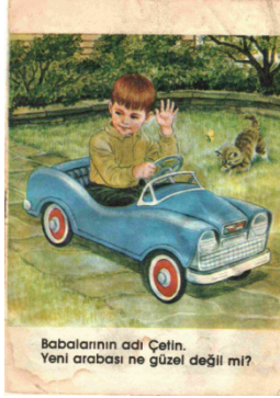
“Babalarının adı Çetin “Yeni arabası ne güzel değil mi?”

derken metin başlangıçta aile içi rol dağılımını da belirlemeye başlıyor. Üç çocuklu ideal bir aile. Çocukların isimleri birbirlerine uyumlu ve ritimli. Aralarındaki hiyerarşi belirlenmiş. En büyük kardeş, diğerlerine göz kulak olmakla yükümlü.