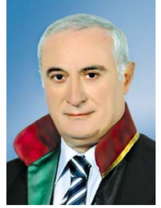
Av. Muammer AYDIN İstanbul Barosu Başkanı

Bazı çevrelerin yoğun saldırısına uğrayan İstanbul Barosu, hukuk mücadelesinden asla vazgeçmedi. Baromuza çeşitli yafta ve yakıştırmalarda bulunanlar bu hukuk mücadelesinden rahatsızlık duyan çevrelerdi. İstanbul Barosu'nun hiçbir ideolojiyle hareket etmediğini, yalnızca hukukun üstünlüğü uğraşısında savaştığını verdiğini kimi uygulamalarımız açıkça ortaya koymuştur. Buna göre İstanbul Barosu, imam hatip liselerinin önünü açmaya yönelik uygulamayı yargıya taşıyıp iptal ettirecek denli laiklik konusunda duyarlı; İsviçre'deki minare yasağını AIHM'e taşıyacak denli de inanç özgürlüğüne saygılı bir kurum olduğunu kanıtlamıştır.