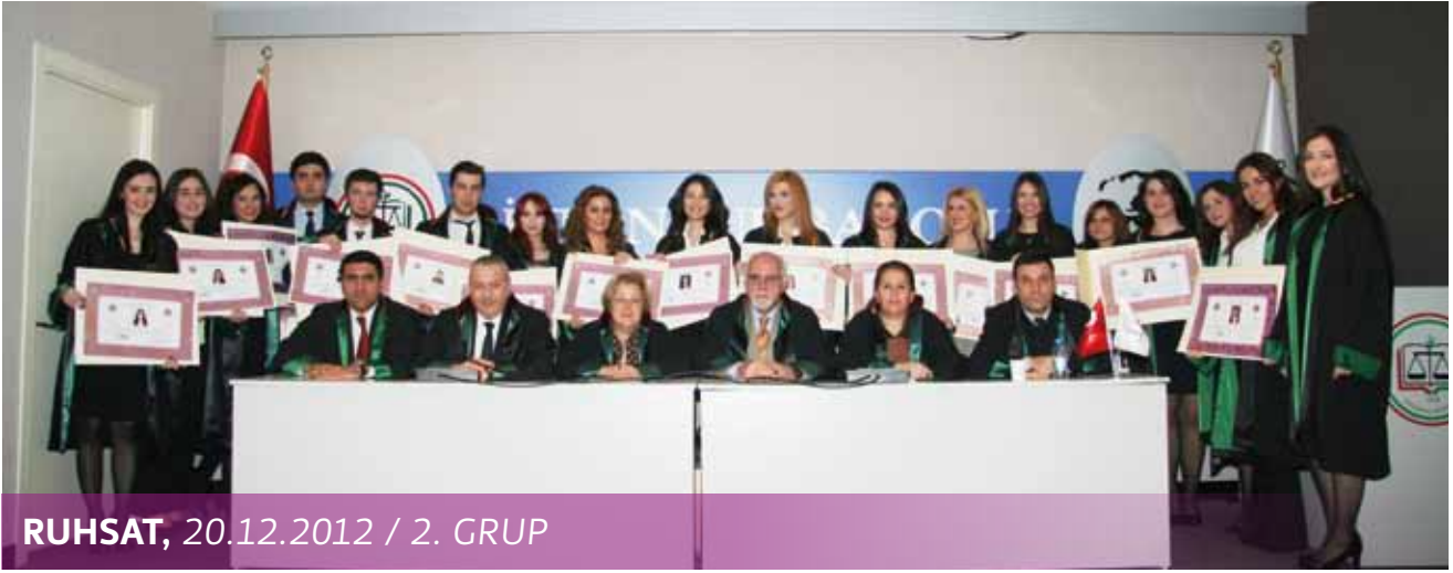
RUHSAT, 20.12.2012 / 2. GRUP