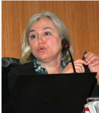
Av. Aynur Tuncel Yazgan

2014 yılında başlayan anayasasızlaştırma çalışmalarının 15 Temmuz’dan sonra artmaya başladığına dikkat çeken Kaboğlu, Anayasa Mahkemesinin ve Avrupa İnsan Hakları Mahkemesinin Şahin Alpay kararlarını irdeledi ve bu kararların Anayasa Mahkemesinin tarihinde bir leke olduğunu bildirdi.