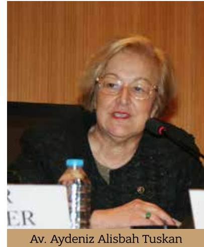
Av. Aydeniz Alisbah Tuskan

Necla Arat sözlerini şöyle tamamladı: “ Mustafa Kemal daha 1920'li yıllarda tehlikeyi gördüğü için kendi deyişle 'bu geri zihniyetin ve kara gücün karşısında' bir an bile tereddüt etmeyecek kadar kararlı ve cesurdu. İşte bugün bizler de Türkiye Cumhuriyeti'nin laik yapısına ve kurumlarına aynı kararlılık ve cesaretle sahip çıkmak ve savunmak, bu yapıyı adım adım değiştirmeye çalışanların etki ve güçlerini yok etmek ödevi ile karşı karşıyayız”.