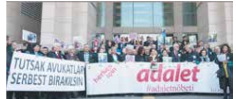
53. ADALET NÖBETİ AVUKATLAR GÜNÜ'NDE TUTULDU

BARO Başkanı, bir gazetesinin yayın politikasının yargıya konu olması yapıldığına ilk kez tank olduğunu söylüyor. Avukatlık mesleğinin de gazetecilik gibi büyük bir sorumluluk olduğunu belirten Durakoğlu, baronun durumunu şöyle anlatıyor: "Bu özel dönemde İstanbul Barosu'nun tarihinin yazılması için yüküleri vardır. Bu yükler, demokrasinin yaşantısına ilişkin mücadelesinin yükleridir." ● CANAN COŞKUN FİLİZ