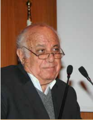
Av. Sinan Naipoğlu