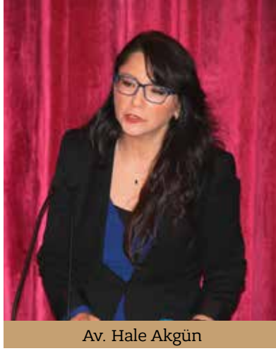
Av. Hale Akgün

8 Mart Dünya Kadınlar Günü etkinlikleri kapsamında İstanbul Barosu Kadın Hakları Merkezi, Kadın Araştırmaları Derneği ve İstanbul Kadın Kuruluşları Birliğinin ortaklaşa düzenledikleri '94. Yılında 3 Devrim Yasası' konulu toplantı, 3 Mart 2018 Cumartesi günü saat 14.00’da Baromuz Konferans Salonunda yapıldı.