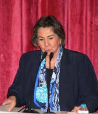
Av. Nazan Moroğlu

dediğimiz şey, aslında önce cumhuriyetin, sonra da demokrasinin alt yapısını oluşturabilmiştir. Şimdi en çok bunu koruyabilmek, bunun mücadelesini yapabilmek konusundaki bilinç hepimiz açısından özel bir değer ifade ediyor”.