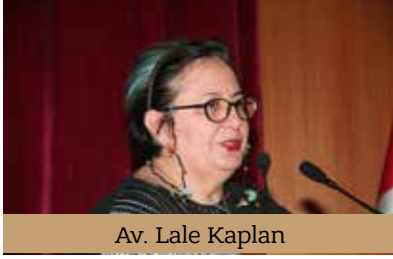
Av. Lale Kaplan