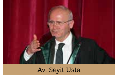
Av. Seyit Usta

Mesleğe ilişkin kalite sorununun sadece eğitim anlayışı içerisinde değil, onun ötesindeki anlayışlarda da biçimlenmeye başladığını hatırlatan Durakoğlu, "Bu çerçevede içerisinde hukuk fakültesini bitirmiş avukat olma iddiasını taşıyan, zorunlu olarak da buraya gelen meslektaşlarımızın mutsuzluğu ile karşı karşıyayız. Bir kısım arkadaşlar 'staja ne gerek var, yapmasak olmaz mı' , bir kısım arkadaşlar da 'staj zo-