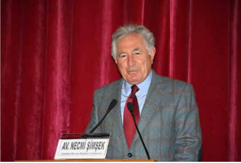
AV. NECMİ ŞİMŞEK