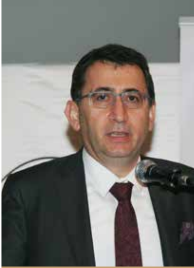
Av. Egemen Gürsel Ankaralı

İstanbul Barosu Lojistik ve Taşıma Hukuku Komisyonu, Galatasaray Üniversitesi ve LODER işbirliğiyle gerçekleştirilen 'Lojistikte Dijitalleşme ve Kişisel Verilerin Korunması' konulu panel, 18 Nisan 2018 Çarşamba günü Galatasaray Üniversitesi Aydın Doğan Konferans Salonunda yapıldı.