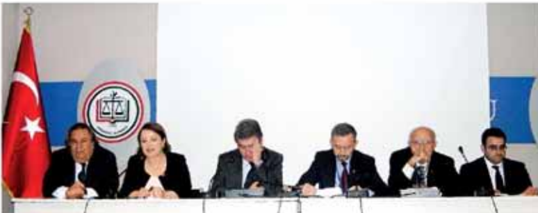
5 oturum şeklinde düzenlenen konferansta açık konuşmalarından sonra yapılan oturumlarda adil yargılanma, usul-deli-iddianame, özel yetkili mahkemeler ve tutuklamalar gibi konular masaya yatırıldı.

"Barış, özgürlük ve adalet" başlığı altında düzenlenen konferansa katılan hukukçu ve gazeteciler, mesleklerinde karşılaştıkları sorunları anlattı