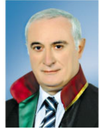
Av. Muammer AYDIN İstanbul Barosu Başkanı

Bunun sağlanabilmesi için Yargı'nın mutlak anlamda bağımsız olması, yani demokrasinin en temel koşulunun yargı bağımsızlığı olduğunu unutmamak gerekir.