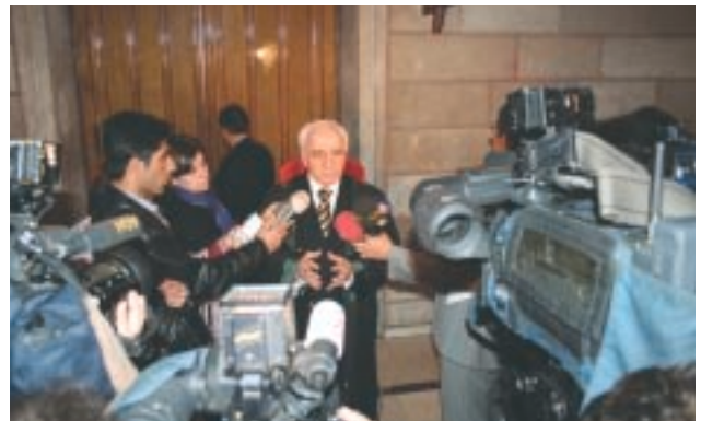
Basın Mensupları etkinliklerimizi izlediler ve özel röportajlar yaptılar. Ancak bunlar, yayına beklenen ölçüde yansımadi.

rettiğinde yargılama giderlerinin karşılandığını böylece hak arama özgürlüğünün kullanımında, varsıl-yoksul, kadın-erkek ayrımı yapılmaksızın herkese eşit olarak mahkemeye