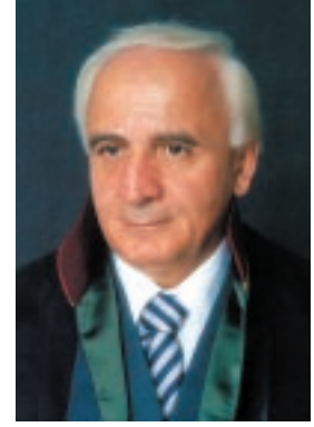
Av. Kâzım Kolcuoğlu İstanbul Barosu Başkanı

Mesleğimizin ve meslektaşlarımızın ciddi sorunları devam etmektedir. Yasamızın meslek sorunlarını yargının genel sorunlarından soyutlamaya olanak yoktur. Bu nedenle, adil yargılanma hakkı kabul edilebilir bir sürede karar elde etme ve adil karara varma açısından öncelikle iyi ve hızlı işleyen, hak ve adaletin gerçekleşmesini sağlayan bağımsız yargının varlığı çok büyük önem taşımaktadır.