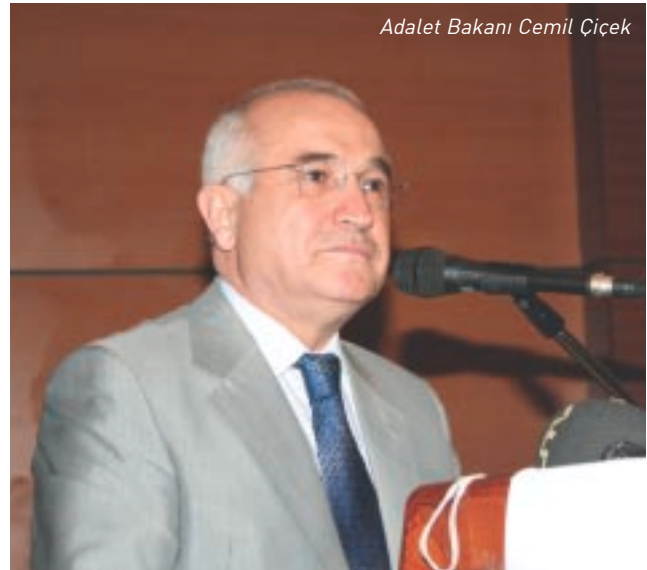
Adalet Bakanı Cemil Çiçek

Adalet erişimi gerçekleştirilmenin en kolay yolunun yasal düzenlemeler olduğunu, gece gündüz çalışılarak bunun gerçekleştirilebileceğini, teknolojik olanakları kullanarak buna hız da kazandırılabilirliğini belirten Cemil Çiçek , ancak hizmetin doğrudan insana yönelik olması nedeniyle uygulamanın büyük ölçü-