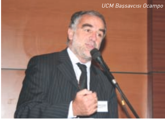
UCM Başsavcısı Ocampo

Roma Sözleşmesine göre Birleşmiş Milletler Güvenlik Konseyine bağlı olarak kurulan Uluslararası Ceza Mah-