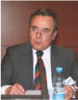
J. Günter Knopp Frankfurt Barosu Başkanı

dünya çapında uyumlu- laştırılması, hâkim ve savcılar arasındaki ilişkilerin geliştirilmesi, avukatın mesleğine erişim aşamaları, hukuk eğitiminin kalitesi gibi konular üzerinde duruyoruz. Baroların eğitimde ciddi çabaları olmalıdır. Bağımsız yargı ve bağımsız baroların adalete daha çok yardımcı olacağına inanıyoruz. Eğer bir ülkede vatandaşlar haklarını ve hukuklarını iyi biliyorlarsa, bu konuda bilinçlenmişlerse adalet daha ucuza gelir. Bu nedenle vatandaşların haklarının öğrenmesinde baroların yapacağı eğitim çalışmalarının büyük katkısı olacağına inanıyorum.”