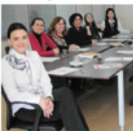
Bakırköy Kadın Meclisi üyelerinin toplantıda oturduğu fotoğraf.

BAKIRKÖY Kadın Meclisi, genel yönetim kuruluyla Kadın Danışma Evi'ni yeni yapıyor. Meclis, kadınlara şiddete karşı bilinçlendiriyor, haklarını korumaları için ücretsiz avukatlık hizmeti veriyor.