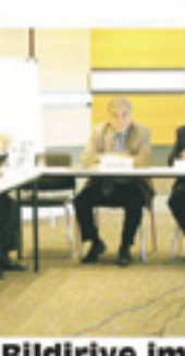
Anayasa değişikliği paketi hakkında konuşan baro başkanlarının toplantı fotoğrafı.

İstanbul Barosu'nun Marmara ve Ege Bölgesi Genişletilmiş Baro Başkan Toplantısı sonuç bildirgesinde, AKP iktidarının anayasa değişikliği paketi sert dille eleştirildi. 15 baro başkanının imzalı olduğu bildiriye, "Anayasa değişiklikleri bu bahçe, 'savuteller ayırtılı' ilkesini ortadan kaldıracaktır. Anayasa değişikliği teklifi, hukuk sistemindeki sorunları çözemeyeceği gibi sorunları daha da içinden çıkılmaz hale getirecektir" denildi.