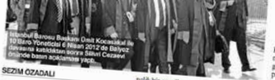
İstanbul Barosu Başkanı Ümit Kocasakal ile 10 Baro Yöneticisi 6 Nisan 2012'de Balyoz davasına katıldıkları sırada Silivri Cezaevi önünde basın açıklaması yapıyor.

SEZİM ÖZADALI İstanbul Barosu Başkanı Ümit Kocasakal ve 10 Baro Yöneticisi hakkında "Yargı görevini yapmanı etkilemeye teşebbüs" iddiasıyla 2 yıldan 4 yıla kadar hapis cezası isteniyor. Davanın savcısı, "Yargı görevini yapmanı etkilemeye teşebbüs" iddiasıyla 2 yıldan 4 yıla kadar hapis isteniyor.