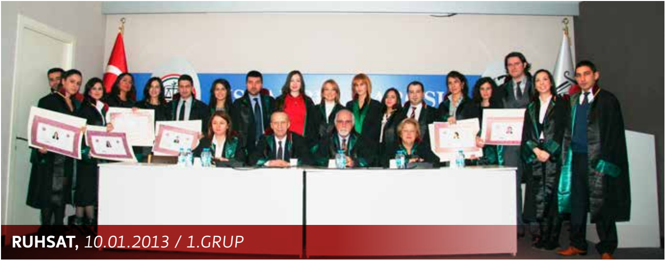
RUHSAT, 10.01.2013 / 1.GRUP