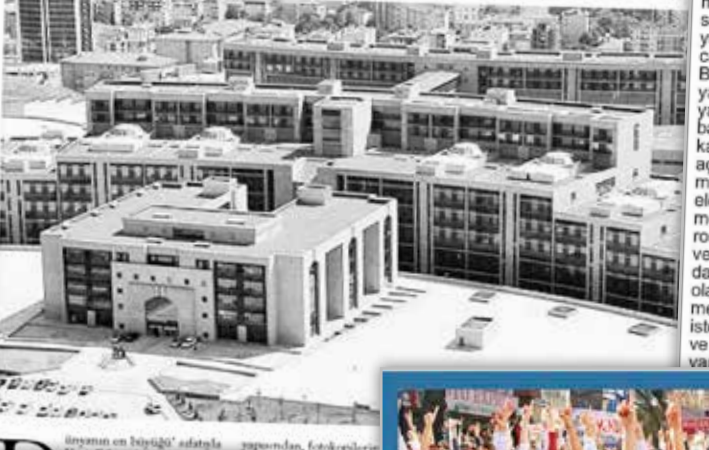
İnsanın en büyükü' adlitala yapısından, fotokopiler için çalınan paraları için masrafları kad Kartal'da Hukukçular Derneği tarafından