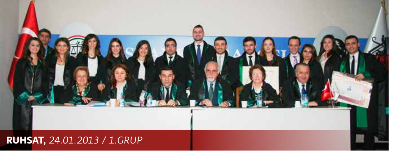
RUHSAT, 24.01.2013 / 1.GRUP