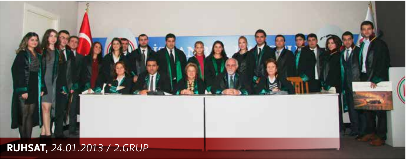
RUHSAT, 24.01.2013 / 2.GRUP