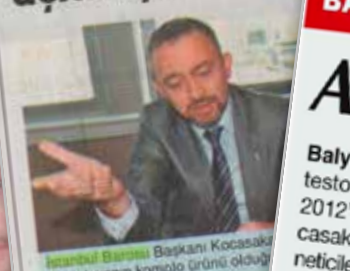
İstanbul Barosu Başkanı Ümit Kocasakal, davasının komple görünüyor