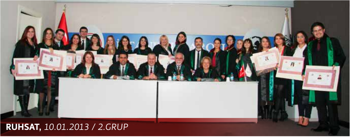
RUHSAT, 10.01.2013 / 2.GRUP