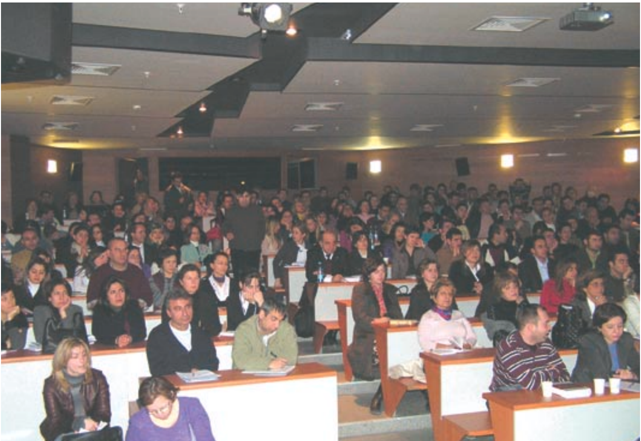
« Kültür Üniver- sitesindeki seminerden bir görünüm

Salon küçük olduğu için yer değişikliğinin yapılması ve Kültür Üniversitesinin daha büyük salonlarının olduğu diğer binaya geçilmesi nedeniyle toplantı gecikmeli başladı. Aynı toplantının baro yönetimi tarafından Anadolu yakasında da tekrarlanacağı sözü verildi. 25 Şubat 2006 Cumartesi günü Yeditepe Üniversitesinde yapılan Boşanma – Mal Rejimleri toplantısına Yargıtay 2. Hukuk Dairesi Başkanı Ali İhsan Özuğur ile üye Ömer Uğur Gençcan konuşmacı olarak katıldılar. ■