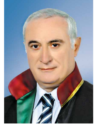
Av. Muammer AYDIN İstanbul Barosu Başkanı

2009 yılı, CMK görevi yapan müdafî/vekil meslektaşlarımızın sorunlarını yoğun yaşadığı bir yıl oldu. CMK Ücret tarifesinin en az asgari ücret tarifesi seviyesine çekilmesine ilişkin Adalet Bakanlığı ve Maliye Bakanlığının üst düzey yetkilileri ile yoğun görüşmelerde bulunduk ve meslektaşlarımıza da bu görüşmelerin içerik ve sonuçları hakkında bilgilendirmede bulunduk. Masraf ödemelerinin vergiye tabi olmadığına ilişkin yargı yoluna baş-