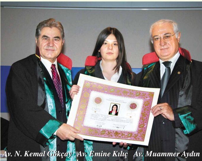
Av. N. Kemal Cökçay Av. Emine Kılıç Av. Muammer Aydın