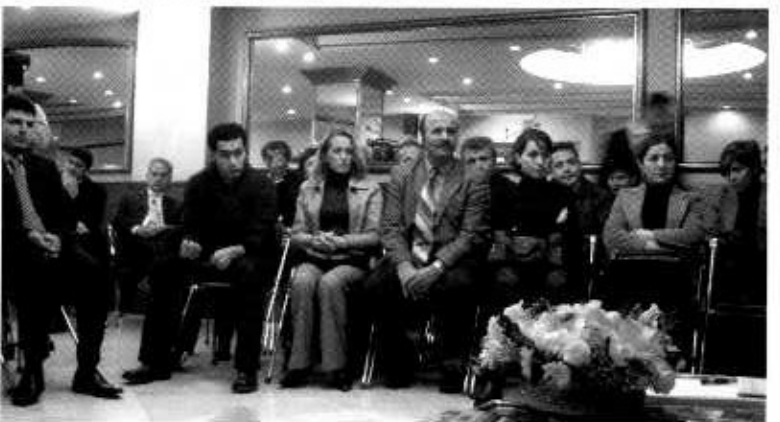
▲ Sağdan: Başkan Av. Kazım Kolcuoğlu ve İstanbul Büyükşehir Belediyesi Başkanı Mimar Kadir Topbaş

İstanbul’un ulaşım ve otopark sorunlarına da değişen Kadir Topbaş, 1 milyon 850 bin aracın trafiğe çıktığı İstanbul’da, 250 bin araçlık otopark bulunduğunu, otopark sorununu çözmek amacıyla bir Fransız firmasıyla görüşmeler yapıldığını hatırlattı. Topbaş, meydan düzenlemelerine önem verdiklerini, özellikle Aksaray, Taksim, Beyazıt, Sirkeci ve Beşiktaş meydanlarında trafiği yer altına alacaklarını, E-5 karayolu trafiğini rahatlatmak için de metro yapımının planlandığını ve ihale aşamasında olduklarını sözlerine ekledi.