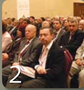
TBB olağan Genel Kurulu Adana'da Yapıldı