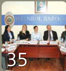
Barolar Arası Değişim Programlarının Uygulamaya Etkileri