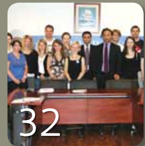
Berlinli Stajyer Avukatlar Baromuzu Ziyaret Ettiler