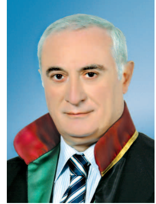
Av. Muammer AYDIN İstanbul Barosu Başkanı

Tutuklu sanıkların duruşmada hazır bulunamaması; kendilerini savunamama, lehe olan husus ve delilleri ileri sürememeleri sonucunu doğurmaktadır. Yine CMK 193/1 gereğince, hazır bulunmayan sanık hakkında duruşma