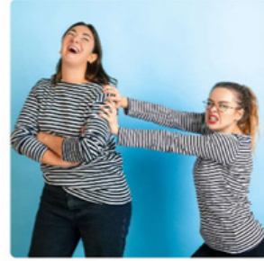
Kadınlar arası rekabet