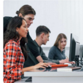
Bilgisayar becerileri/ Dijital yetkinlik