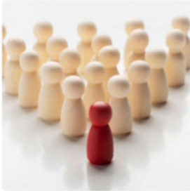
Liderlik ve kişisel gelişim